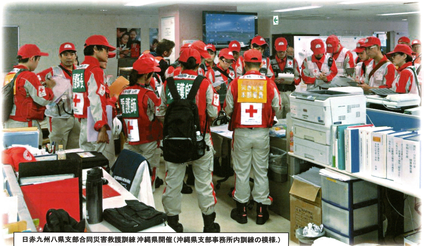
日赤九州八県支部合同災害救護訓練 沖縄県開催(沖縄県支部事務所内訓練の様様。)